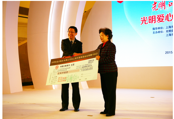
光明爱心基金发布会

起，光明联合上海和平眼科医院启动为期三年的“和平·光明行”眼底病筛查防治大型公益活动。计划为上海地区40岁以上并有10年以上糖尿病史的患者和糖尿病性视网膜病变患者提供公益眼检，并有针对性的开展相应治疗。针对家庭困难的注射治疗、手术治疗的患者，光明爱心基金还将给予全额资助。