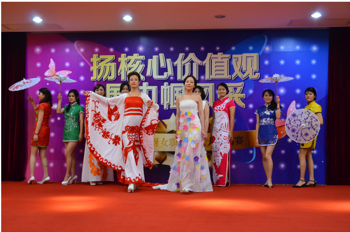
“妈妈咪呀”光明女职工才艺大赛

各社区先后成立了钓鱼协会、乒乓球协会、门球协会等，组织员工居民开展花卉、卡拉OK、编织、运动会、广场舞等比赛和娱乐活动。在关心职工、居民方面，各社区通过走访、座谈，收集意见达近百条，成功解决多起困难诉求，提升了职工、居民的归属感。