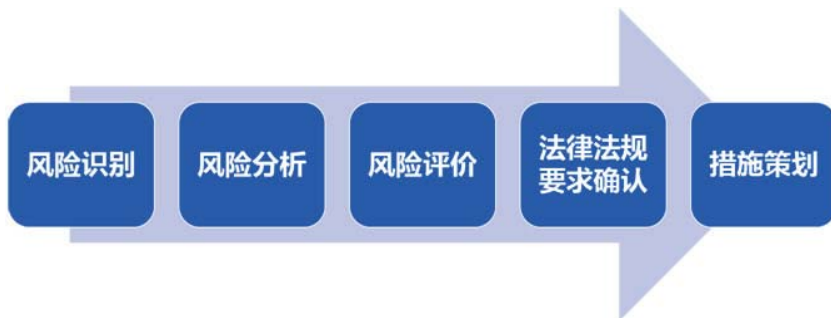
图2 策划应对风险措施的流程图

(2) 组织的第一责任人应发挥领导作用，制定响应突发公共事件的方针和目标，建立满足响应突发公共事件需要的组织体系（如应急领导小组和应急工作组），并明