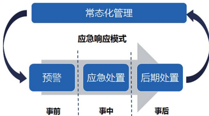
图3 应急响应模式图