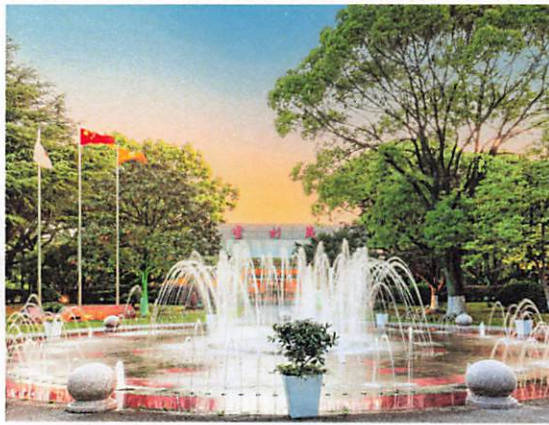
云杉苑电信培训中心实景图